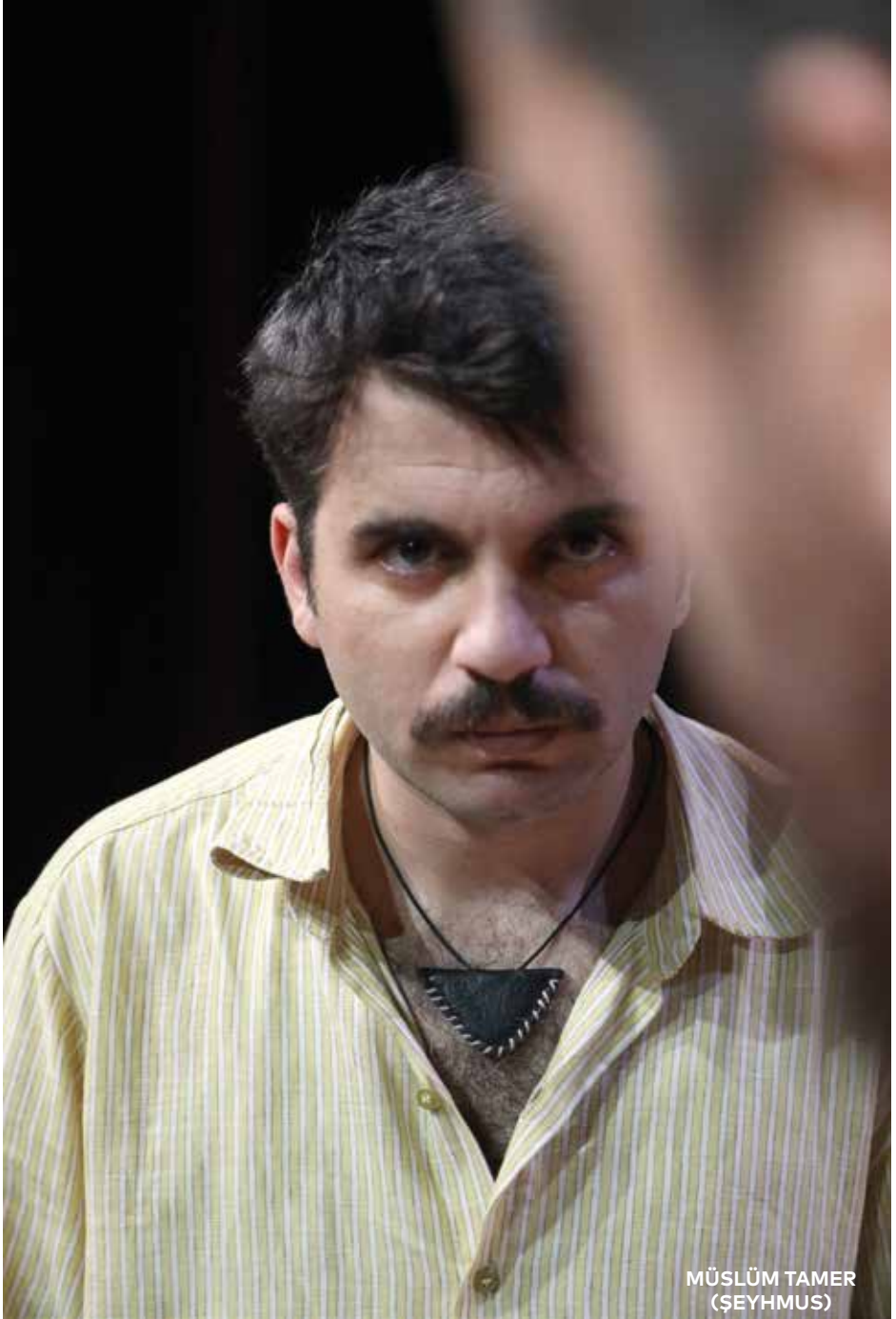
MSLM TAMER (EYHMS)